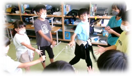
何を決めているの？じゃんけんは、どんなときでも盛り上がります。