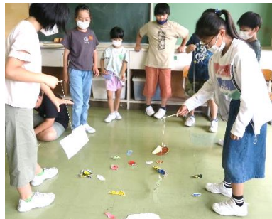
魚の絵を描き、クリップをつけて磁石で魚釣り。