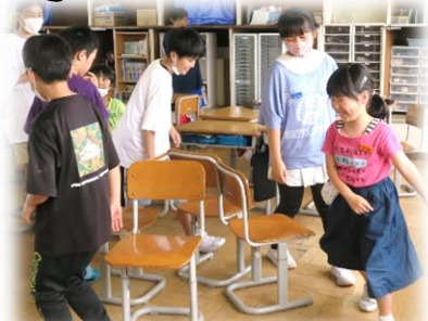
音楽はタブレットで、椅子取りゲーム。便利な道具。