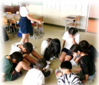
ハンカチ落とし。自分の後ろにあるかとドキドキ。

■わたしの班では、めあてを達成することができたと思います。ゲームを通して、あまり話したことのない人とも会話したり、楽しみながら協力したりできました。相手を思いやり、嫌な声も聞こえなく良い時間になったと思います。もう少し班の人と名前を呼び合えたらなと思います。名前呼び合うことで、班の人の中でも協力し合えるより良い班になると思います。(中略)自分たちで考えながら、楽しめたにこにこフェスティバルだと思いました。その後の掃除でも、名前を呼びながら活動をしています。【6年児童】